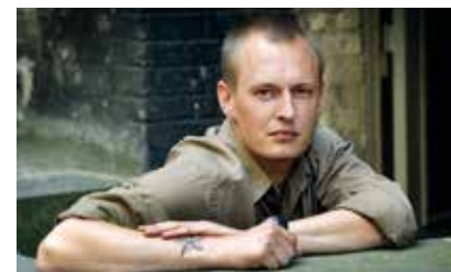
Christian Holten Bonke DK 2015 75 min

I filmen kæmper hans to bedste venner sig op mod toppen af Kilimanjaro for at sige endeligt farvel og i al hemmelighed opfylde Ejersbos ønske om at få spredt sin aske netop dér. Undervejs fortæller filmen gennem venner, familie og kolleger om den målrettede, ekstraordinære og gådefulde forfatters ellers ret private liv og om hans kamp for at fuldføre trilogien med døden i hælene.