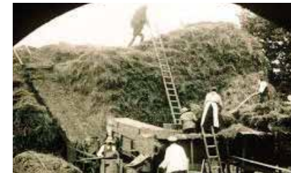
ukendt instruktør DK 1921 15 min

Ganske vist gik der mange år, før teknik og kemi for alvor greb ind i den naturlige cyklus, men tendensen i retning af flere afgrøder på samme jord produceret med flere maskiner og færre folk er ikke til at overse. Der er tysk/franske mellemtekster!