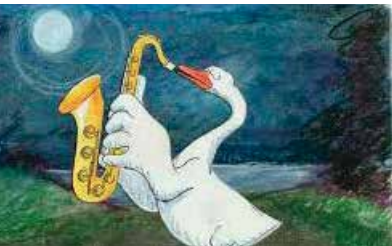
Flemming Quist Møller & Jannik Hastrup DK 1982 12 min