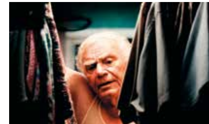
Sean Penn US 2002 10 min