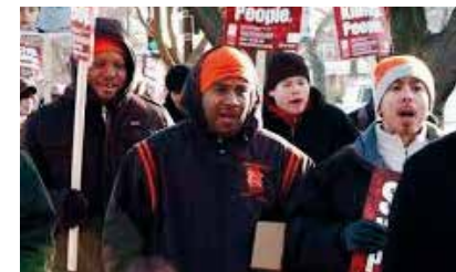
Steve James DK/US 2011 119 min

Filmen er lang og kan fylde vores aften, men vi vil for en gangs skyld være grove og afbryde, før den er færdig, for Chicagos Gadeengle er også en påtrængende film – af nyere dato – som giver et værdifuldt indtryk af det barske sorte miljø i storbyen Chicago , men også af det arbejde tidligere kriminelle og fængslede udfører for at genrejse respektfuld adfærd og (racemæssig) stolthed. Heller ikke denne film kan vi vise i fuld figur, men begge kan I selv finde og se færdige via Filmcentralen.dk .