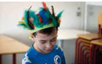
Andreas Koefoed DK 2015 59 min

Nogle familier får afslag på asyl og sendes tilbage til deres hjemland, nogle går under jorden, mens andre flytter ud i samfundet. Vi følger de fem børns forsøg på at lære sproget, knytte venskaber og gøre sig klar til at blive danskere.