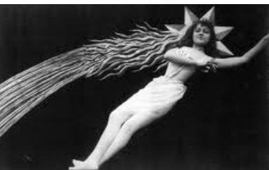
George Méliès Frankrig 1904/1994 7 min