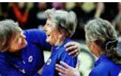
Gunhild Magnor Norge 2013 80 min

Optimisterne er en varm, bevægende og morsom dokumentarfilm om et meget usædvanligt volleyball team i byen Hamar, bestående af damer i alderen 66-98 år. Selvom holdet har trænet en gang om ugen i 40 år, er der ikke blevet spillet en eneste kamp i de sidste 30. Men nu har de endelig besluttet sig for at lave om på det, og så er spørgsmålet bare, mod hvem de skal spille? Måske kan de finde et hold flotte fyre i nabobyen Brumunddal? Eller måske skal de hele vejen til Sverige for at finde et værdigt modstanderhold? Måske endda et hold af gamle mænd??