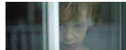
Domstoladministrasjonen Norge 2012 36 min