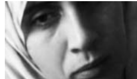
Stig Dalager Danmark 2002 82 min

Har vi, magtesløse, vænnet os til, at netop denne konflikt er uløselig? Hvorfor er der ingen sanktioner mod Israels diskriminerende politik? Hvad gør palæstinenserne forkert, om noget? Har et undertrykt folk (stadigvæk) altid ret?