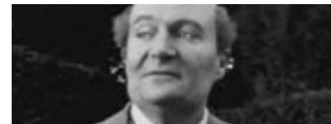
Mike Leigh England 1992 22 min

Mike Leigh er i øvrigt kendt for nærgående social-realistiske spillefilm, hvor skuespillerne udvikler historien sammen med instruktøren.