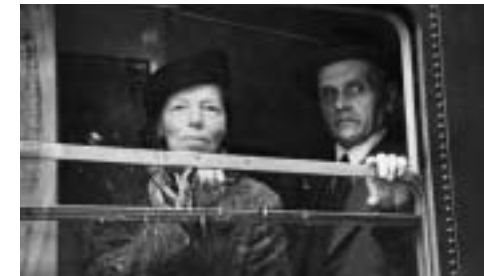
Sonja Vesterholt Danmark 2003 52 min

Olga var varm og ligefrem og i øvrigt en fremragende maler. Hun sluttede sit liv i Canada, altid elsket af sine omgivelser. Olgas liv var overvældende kontrastfuldt. Det rummede lidenskab og forbudt kærlighed, mod og udholdenhed.