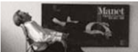
Jørgen Leth Danmark 1999 40 min

Søren Ulrik Thomsen forløst i mageløs smuk sort/hvid film af Jørgen Leth. Denne gang er det ikke instruktøren, men den skildrede forfatter, som forholder sig til filmen sammen med publikum.