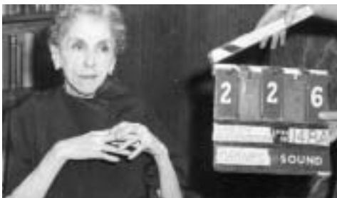
Christian Braad Thomsen Danmark 1995 90 min