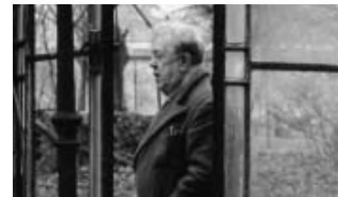
Ole Roos Danmark 1995 52 min

Vi oplever misantropen Michel Simon fortælle om sit brogede liv, vi ser udvalgte klip fra hans film og møder ham i vinterhaven i det gamle hus, med alskens erotisk kunst, masser af kæledyr og forbudte pornofilm.