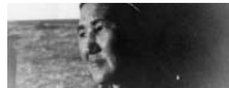
Sergei Dvortsevoj Kasakhstan 1995 23 min

Vi ser kvinden, der bager i jorden og vasker op med tungen, drengen der falder bagover og i søvn efter at have spist sit måltid, koen hvis hoved sidder fast i mælkejugen. En impressionisme der giver sig tid uden at kede et øjeblik.