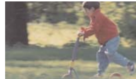
Marcel Lozinski Polen 1995 39 min