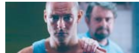
Daniel Espinosa Danmark 2003 37 min

Nick vil – som Sylvester Stallones Rocky – gerne væk fra den grå forstad. Han deler lejlighed med Palle, som han har kendt altid. Nick får chancen for en stor kamp i Hamborg. Men samtidig opdager han, at Palle har alvorlige problemer med de lokale gangstere. Nick skal vælge mellem sin drøm om at slippe væk og sin bedste ven.