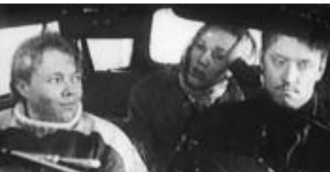
Henrik Ruben Genz Danmark 1995 35 min