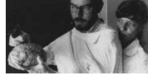
Jorge Furtado Brasilien 1989 13 min