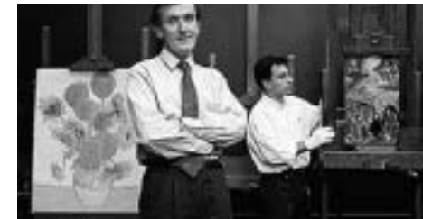
Forskellige Danmark 2004 4 x 5 min