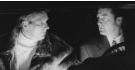
Anders Thomas Jensen og Thomas Villum Jensen Danmark 1996 11 min