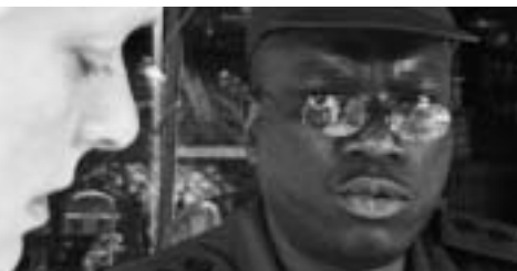
Mette Zeruneith Danmark 2005 106 min

Både historien og produktionshistorien er usædvanlige. Steve, en flygtning fra Uganda, kontakter en filmproducent for at få sin historie på film. Han har en fortid som børnesoldat i Uganda og har opdaget, at hans egen søn også er det. Han vil finde ham og i al hemmelighed befri ham. Herfra udvikler historien sig. Steve forsvinder. Steve kommer tilbage. Et filmhold tager med til Afrika. Deres optagelser og udstyr forsvinder. De genfinder en del bånd i en affaldsbunke. Ugandas regering melder sig og siger, at Steve er kriminel. Filmholdet filmer dem og tager igen til Uganda. Undervejs har Steve været i fængsel, udsat for tortur. Han har bragt sin søn til Danmark. Han er selv forsvundet for gud-ved-hvilken gang. Historien ender aldrig.