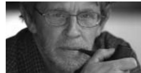
Søren Ryge Petersen