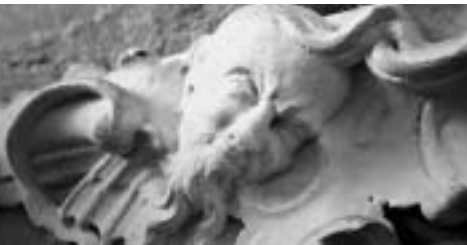
Nils Vest Danmark 2005 58 min