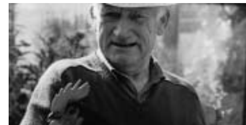
Peter Klitgaard Danmark 2005 79 min

Om dronning Margrethe taler rigsdansk? Ja, det gør hun vel per definition. Men måske er det alligevel en særlig royal dialekt hun bringer med ind i filmen?